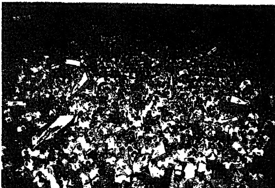
الجمعة تحتفل مجدداً ببلدة قصر بعبدا (بشارة الشهابي)